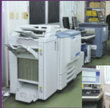
2台のPOP専用機がシビアな納期要求に応える 手前：RISAPRESS Color510 奥：RISAPRESS Color651