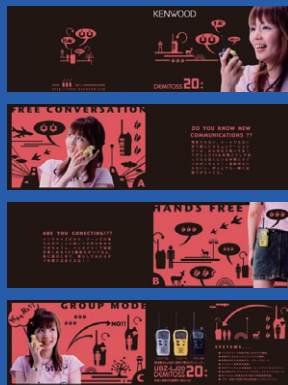
株式会社ケンウッド トランシーバー「DEMITOSS 20」雑誌広告・販促用カタログ編集デザイン