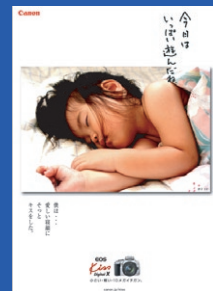
キヤノンマーケティング ジャパン株式会社 「EOS Kiss Digital X」 ポスター